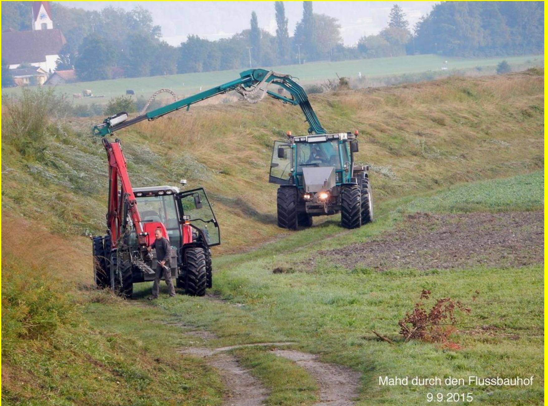
Mahd durch den Flussbauhof 9.9.2015