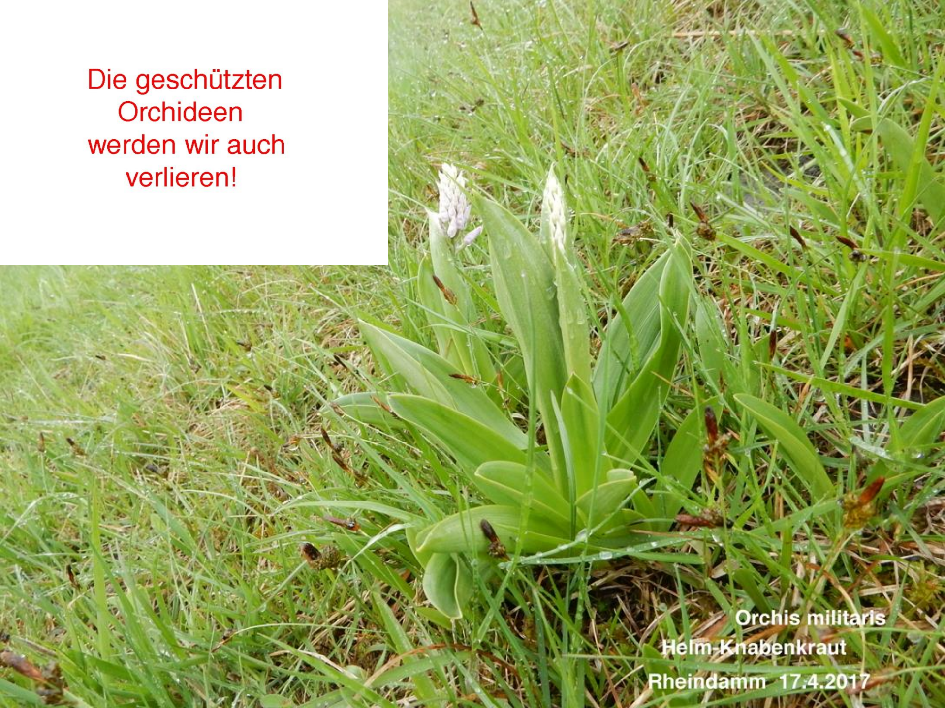
Orchis militaris Helm-Knabenkraut Rheindamm 17.4.2017

Die geschützten Orchideen werden wir auch verlieren!