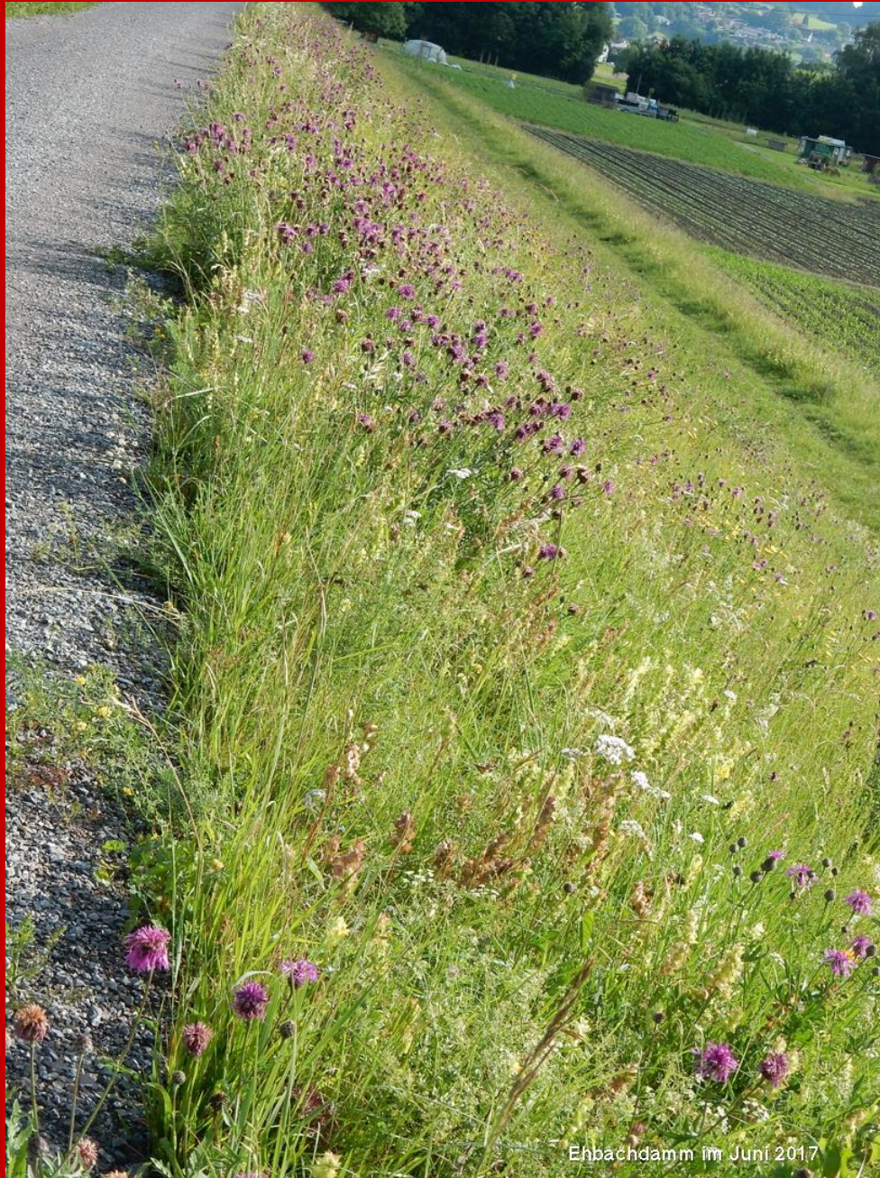
Erbäcldamm im Juni 2017