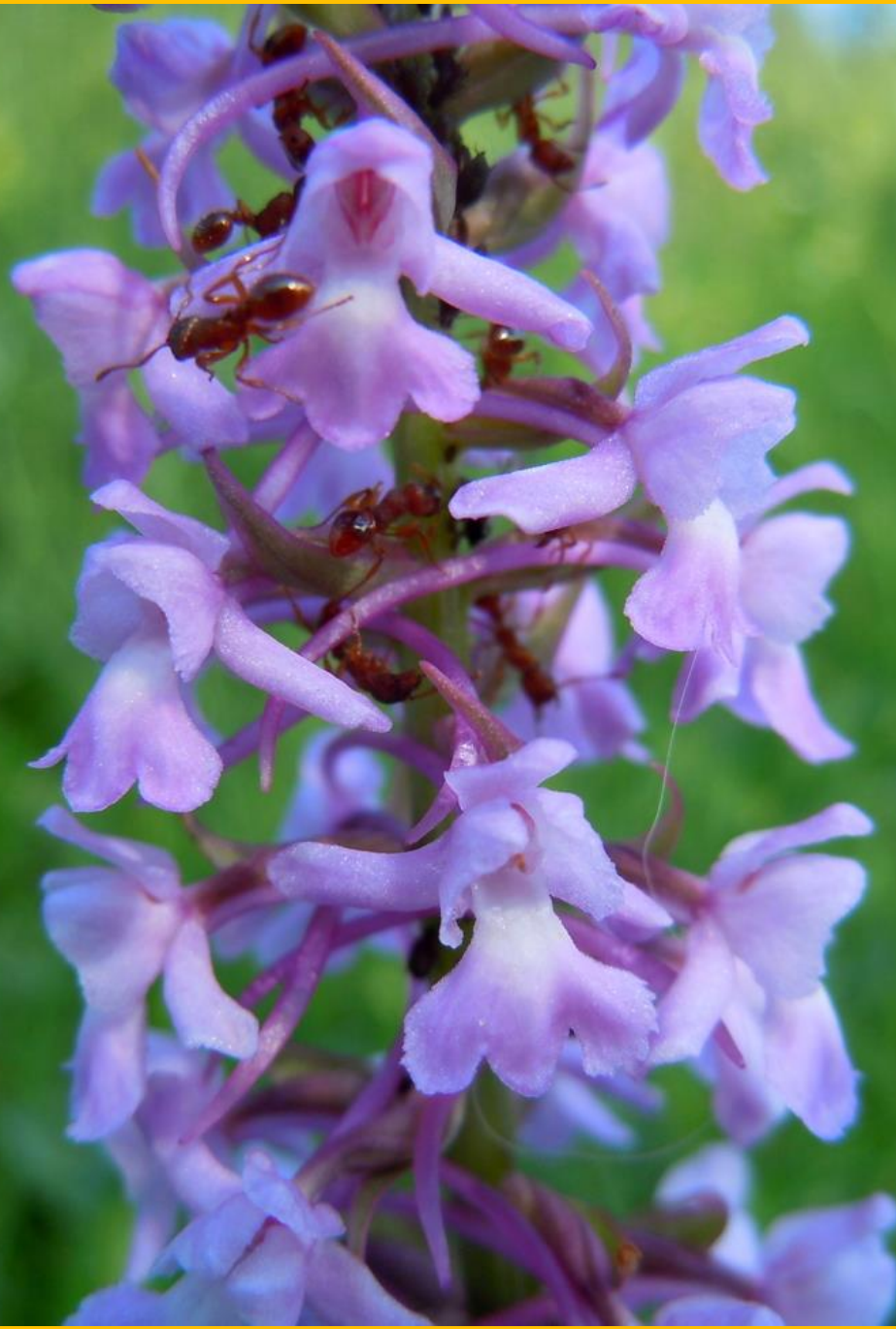
Gymnadenia conopsea Große Händelwurz