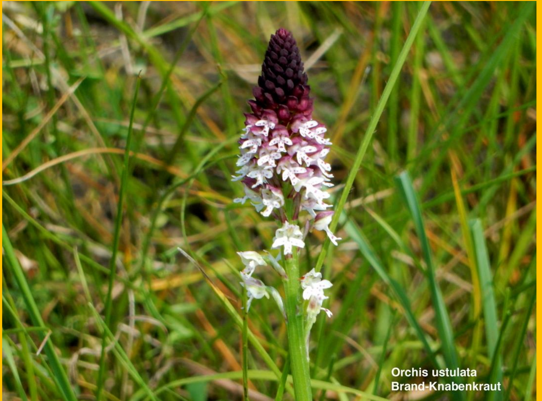
Orchis ustulata Brand-Knabenkraut