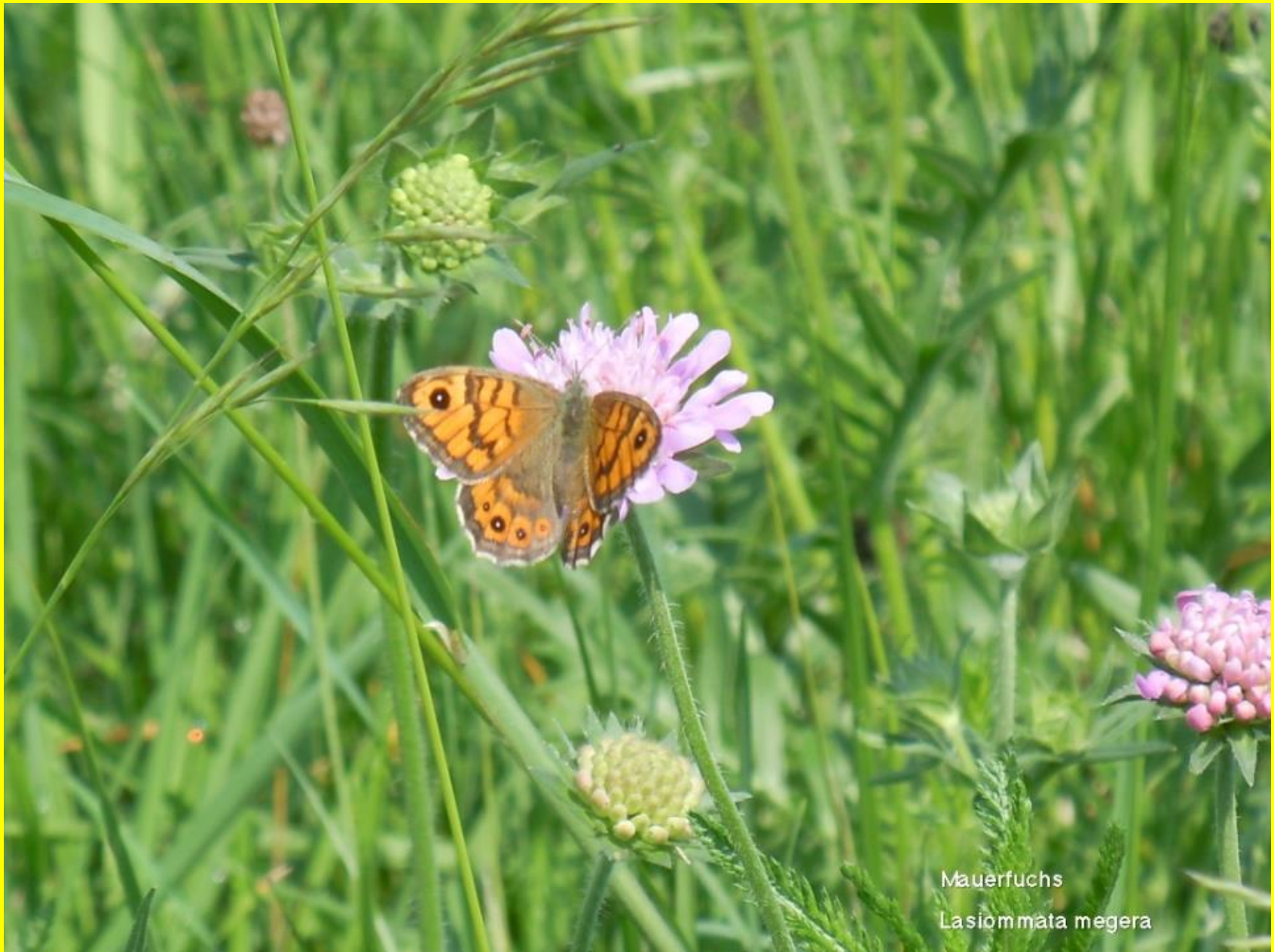
Mauerruch Lasiommata megera