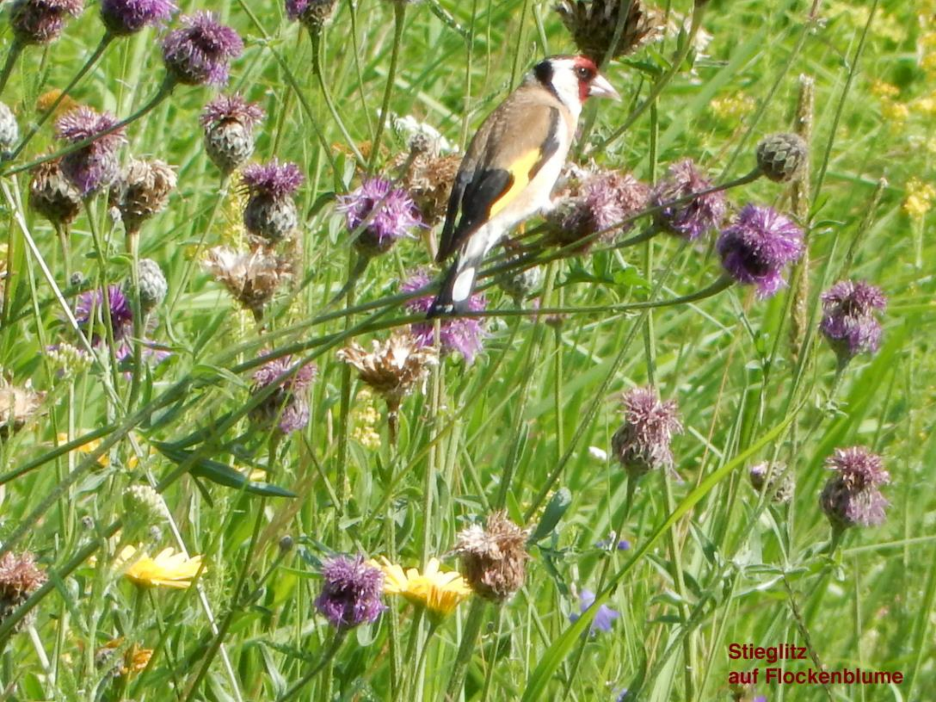
Stieglitz auf Flockenblume