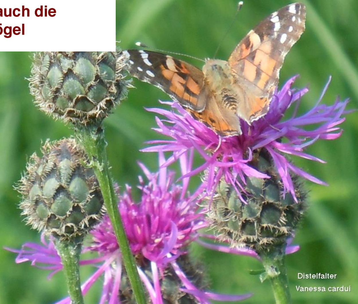
Distelfalter Vanessa cardui