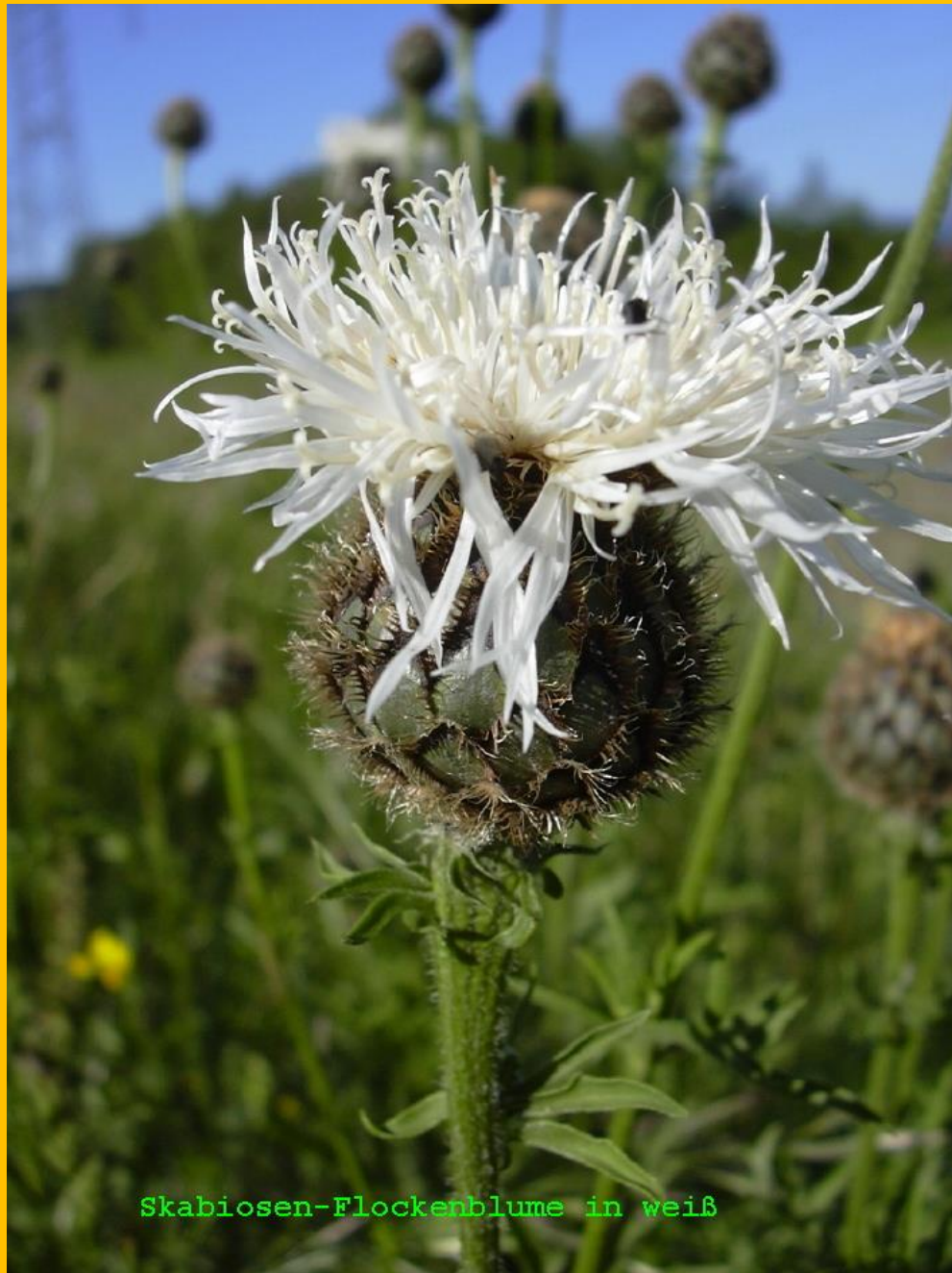
Skabiosen-Flockenblume in weiß