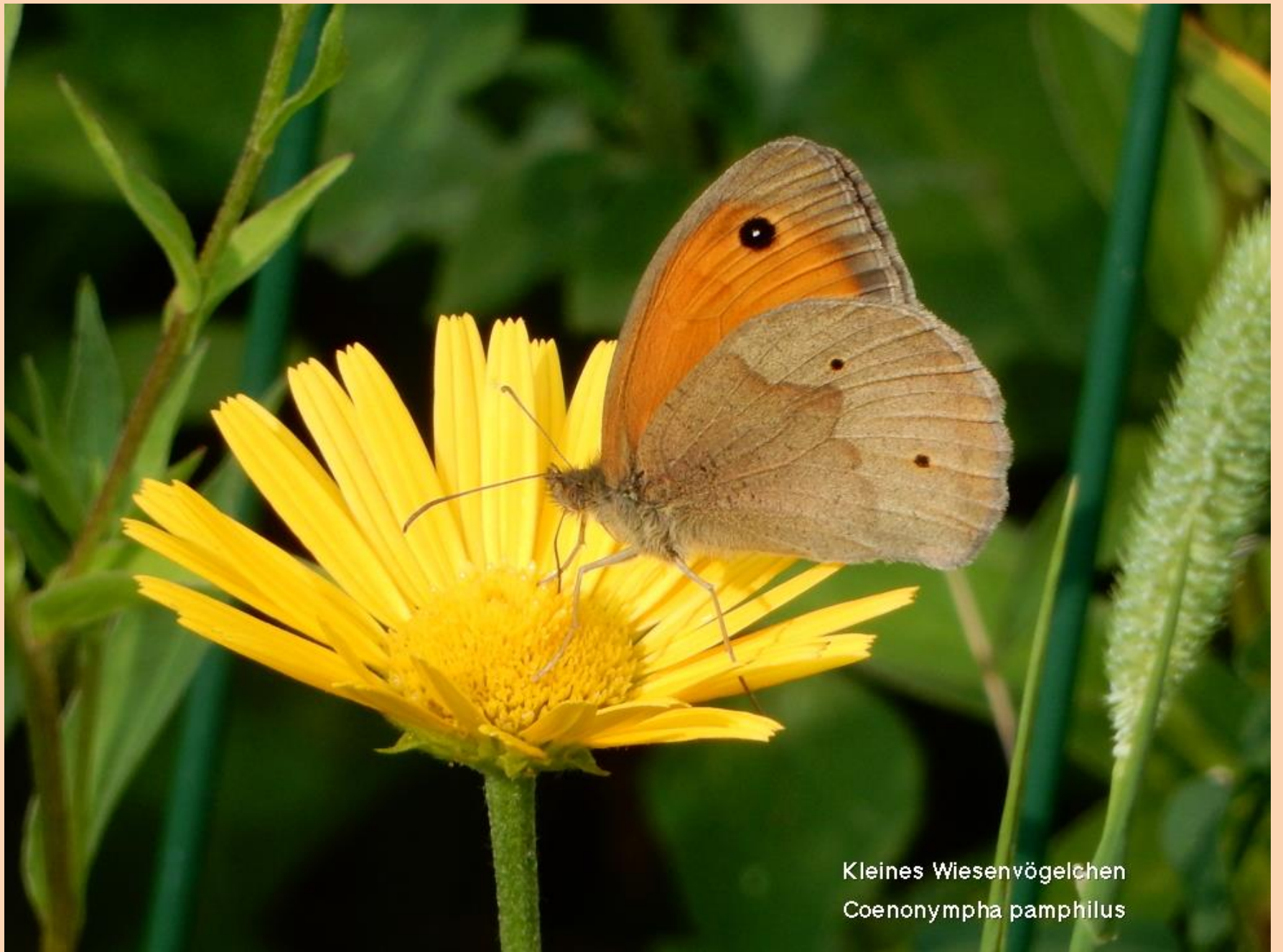
Kleines Wiesenvögelchen Coenonympha pamphilus