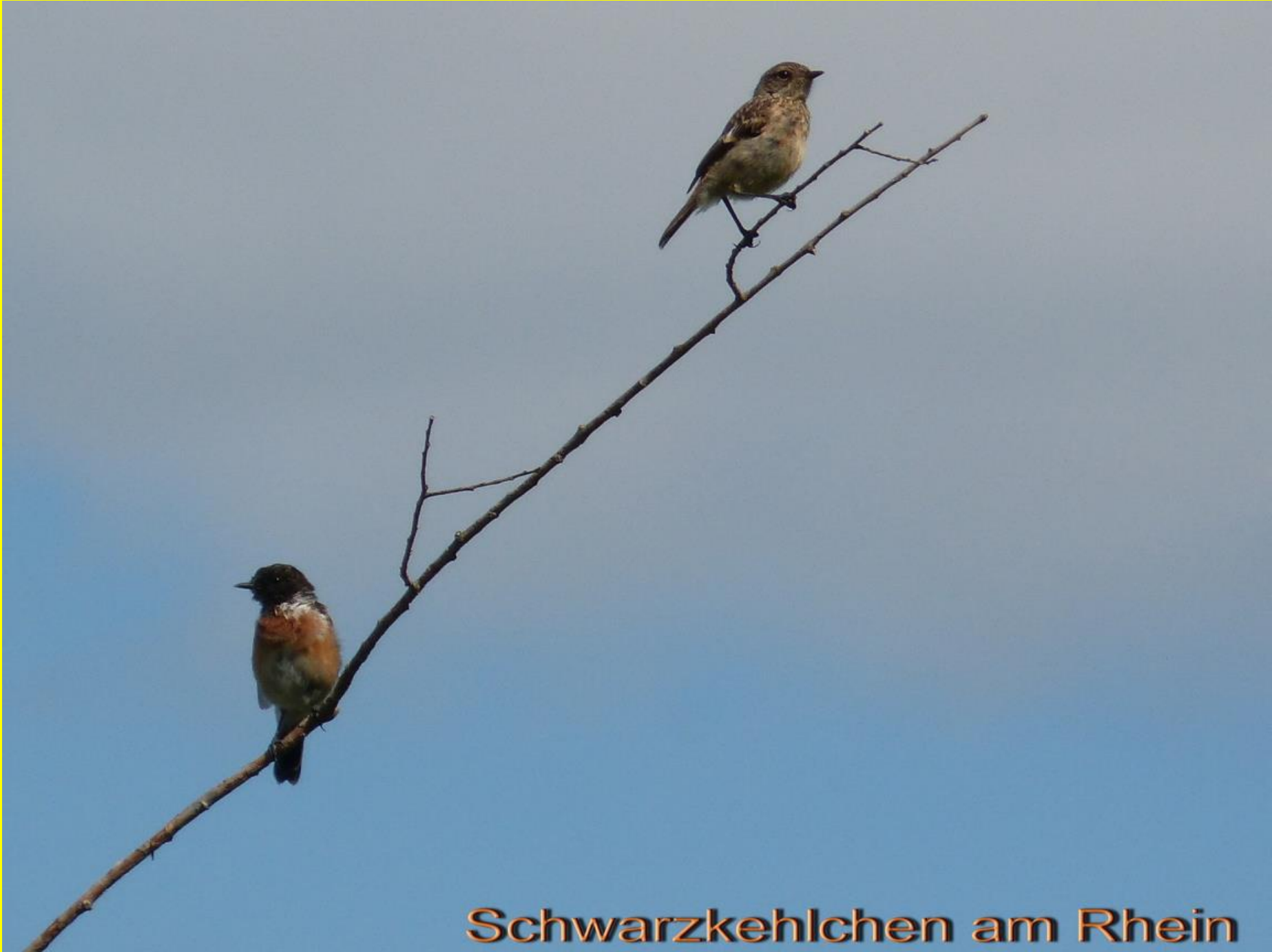
Schwarzkehlchen am Rhein