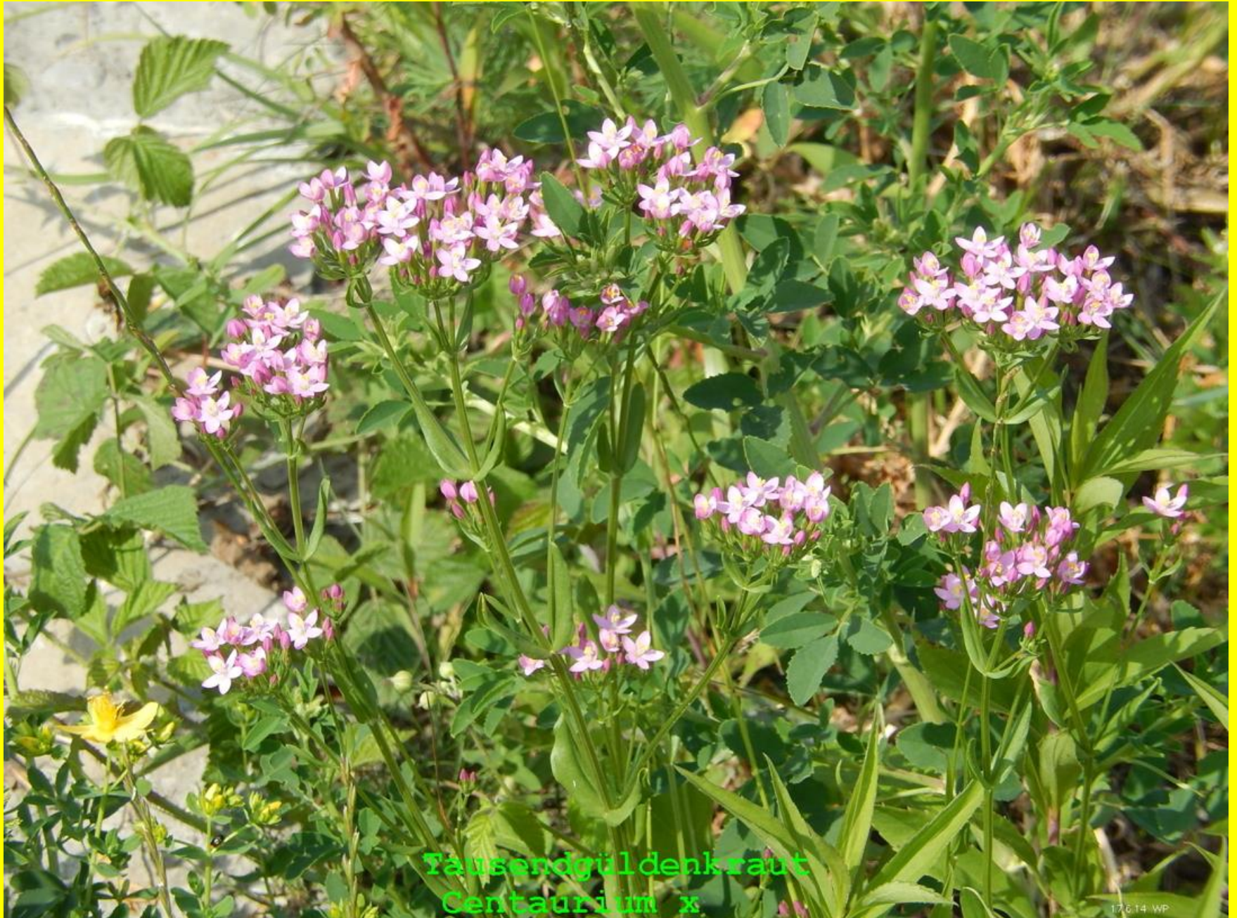
Tausendgüldenkraut Centaurium x