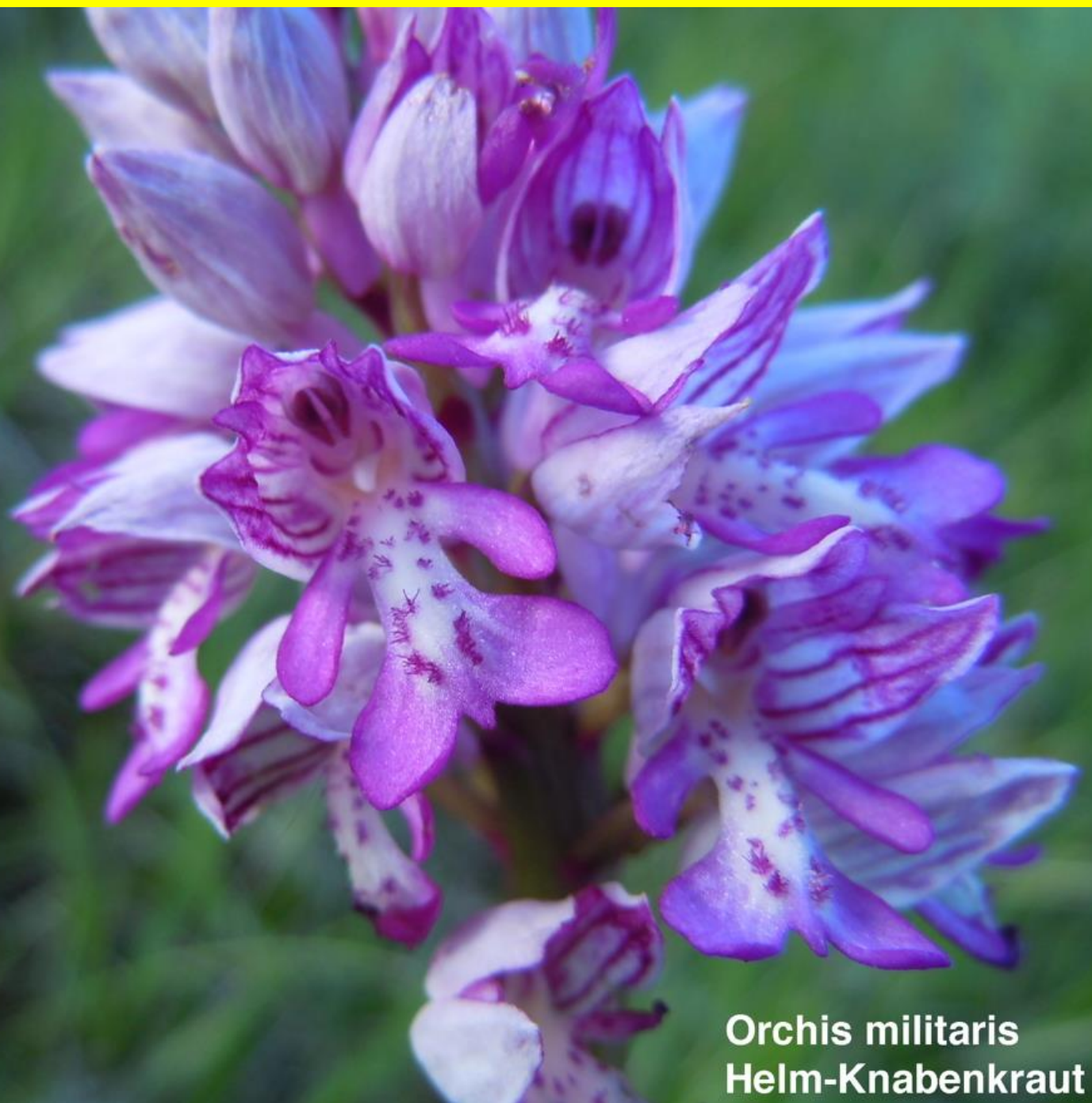
Orchis militaris Helm-Knabenkraut